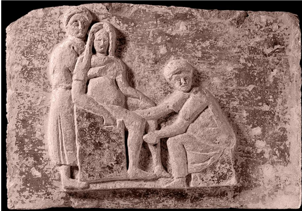
Relief en terre cuite sur la tombe de Scribonia, sage-femme Ostie, 1er s. après J.-C.