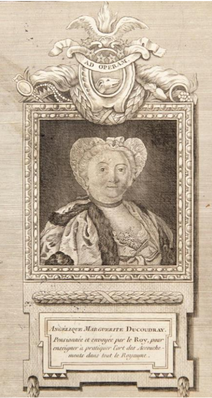
Angélique Du Coudray 1712 - 1794