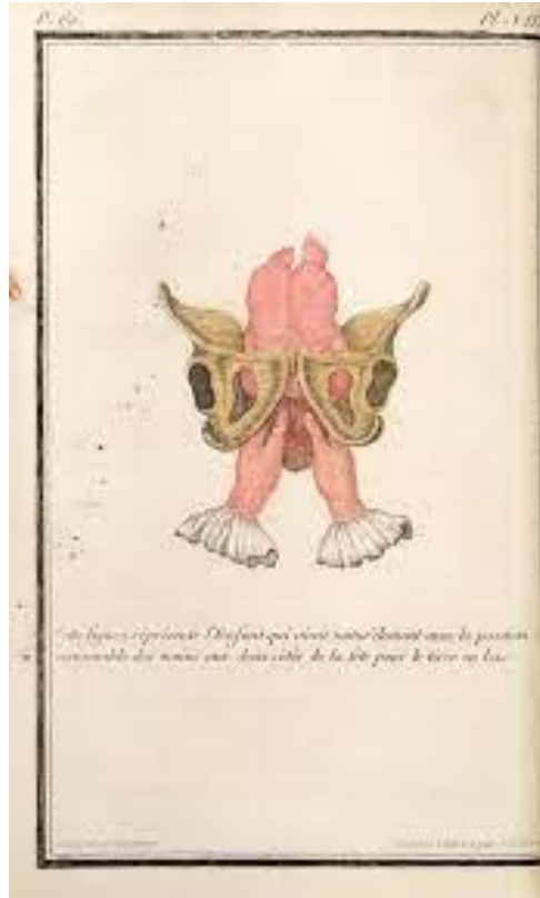
Abrégé de l'art des accouchements - 1759