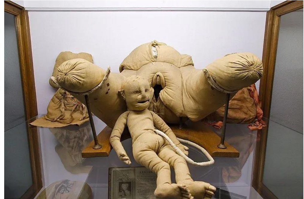
La machine d'Angélique Du Coudray – Musée Flaubert et d'Histoire de la Médecine – Rouen