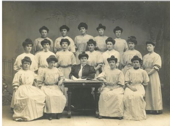
Promotion 1907-1909 des élèves sages-femmes de l'hôpital de Grenoble Musée grenoblois des sciences médicales