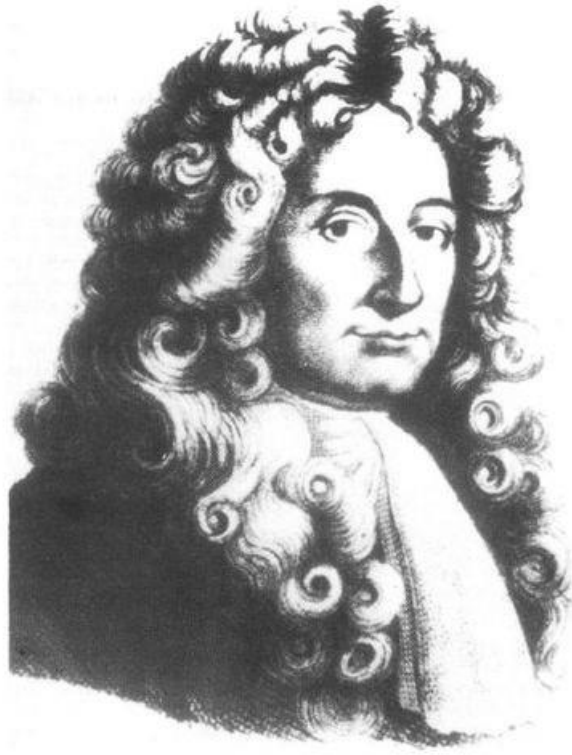
François Mauriceau 1637 - 1709