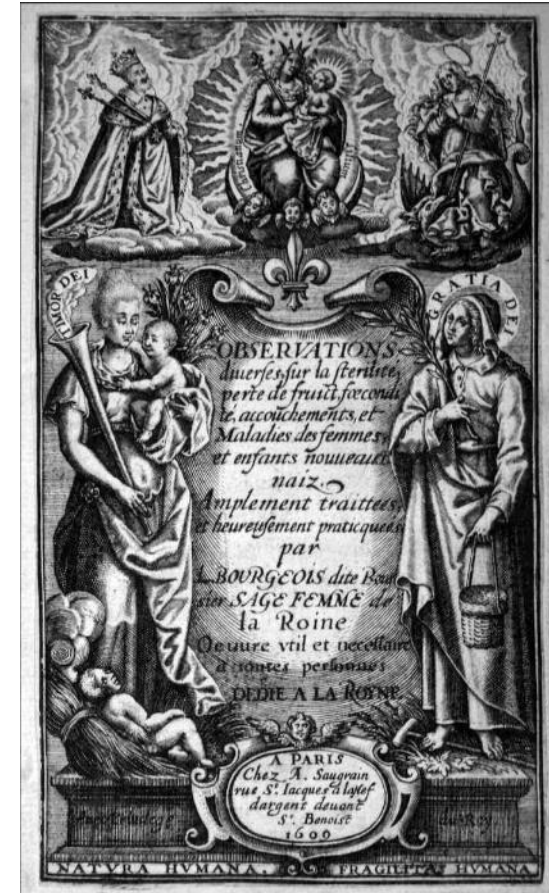
Les Observations, 1609, Paris, chez A. Saugrain