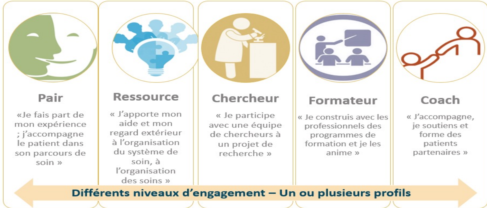
Figure : Schéma représentant les différents profils de patients partenaires aux HCL.